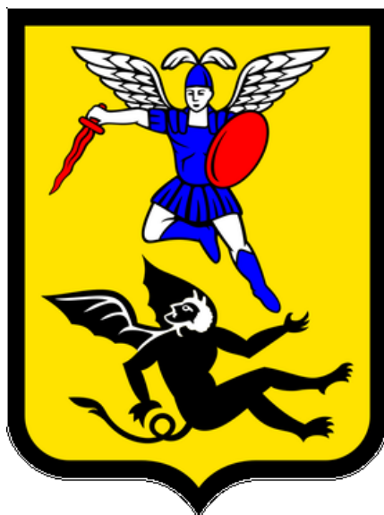
Схема теплоснабжения муниципального образования городской округ «Город Архангельск» до 2040 года